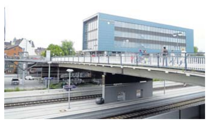
Die berühmteste Hörder Brücke ist die am Brückenplatz. Am Sonntag kommen 15 weitere hinzu.

HÖRDE. „Über sieben Brücken musst Du geh'n“ haben Karat und Peter Maffay gesungen. Wer am Sonntag (30. 6.) beim ersten Hörder Brückenfest alles sehen möchte, muss über 15 Brücken gehen.