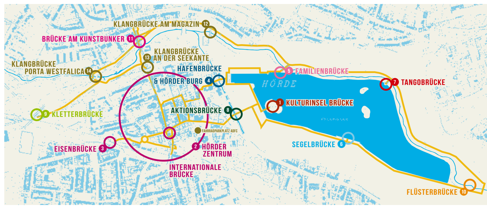
14 Spielorte hat das erste Hörder Brückenfest am Sonntag im und rund um den Ortskern. Zu Fuß kann man sie alle problemlos erreichen. Grafik Schmedes