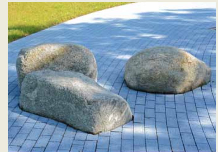
Spielen und Sitzen auf Felsen im Blauen Band