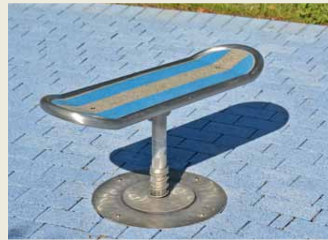
Spielerisches Surfen für Klein und Groß

Das Tiefbauamt, Abteilung Stadtgrün, hat die Umgestaltung geplant und die Bauausführung beaufsichtigt. Bauausführendes Unternehmen ist die Meyer's Garten- und Landschaftsbau GmbH aus Arnberg.