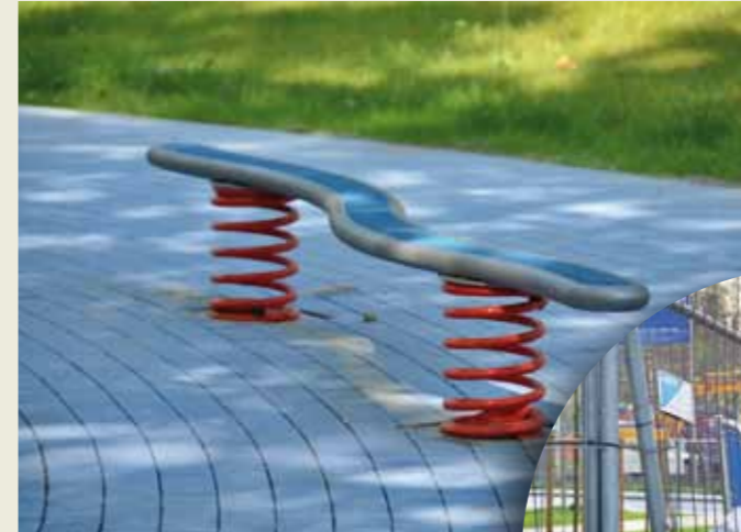
Balancieren im Blauen Band