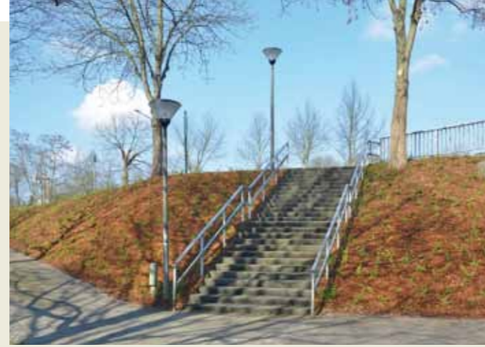
Neue Bepflanzungen an den Böschungen